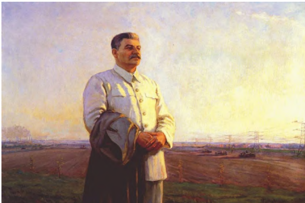
«Утро нашей Родины» художника Фёдора Саввича Шурпина.